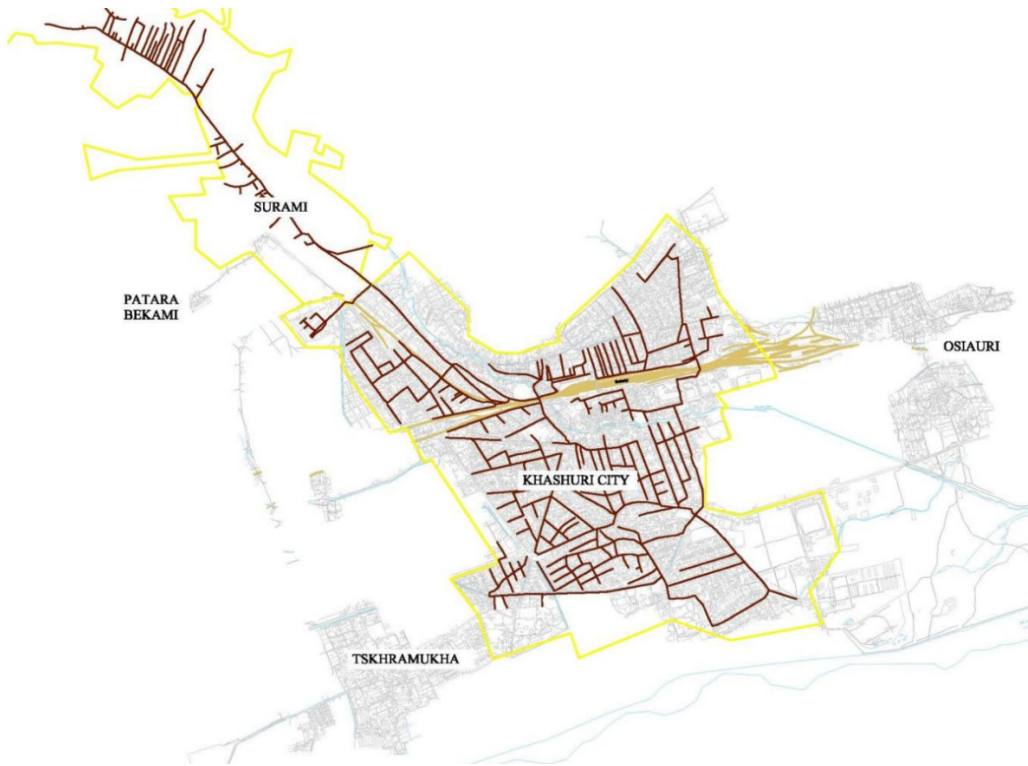
რუკა 1. ხაშურის არსებული კანალიზაციის სისტემა.

ქვემოთ მოცემულ პირველ და მეორე რუკებზე წარმოდგენილია არსებული კანალიზაციის სისტემა და წყალმომარაგების დაპროექტებული ქსელები: